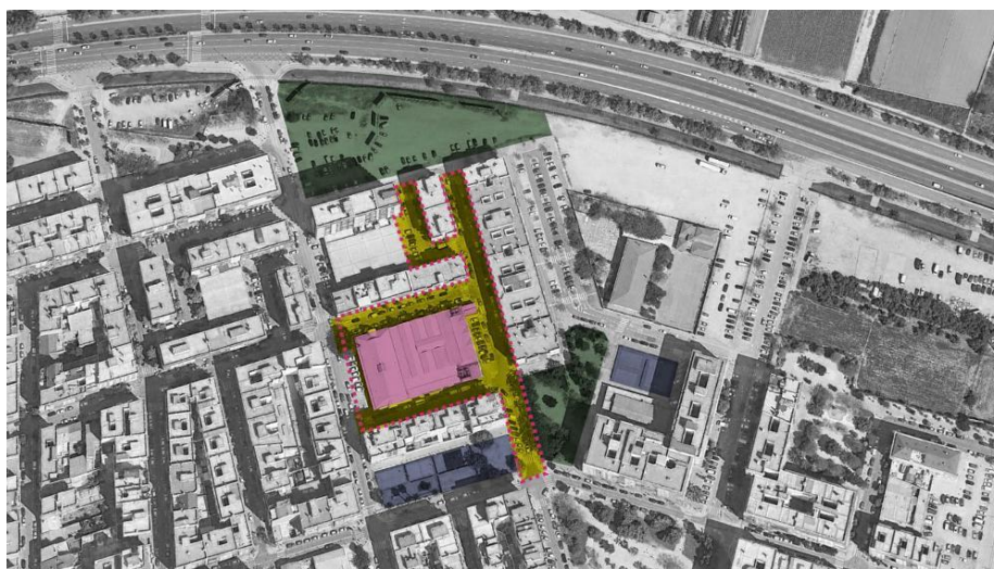
Imagen 4: Plano del proyecto de peatonalización de las calles que rodean el mercado

Fuente: Ayuntamiento de Valencia. Fecha de consulta 3 de Febrero de 2023.