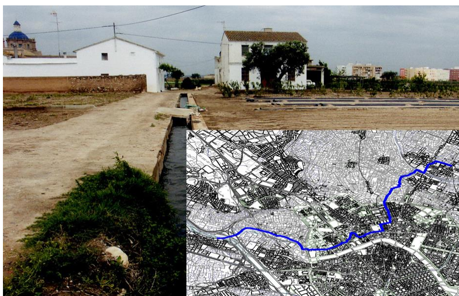
Imagen 1: Acequia de Rascanya perteneciente a la Vega de València