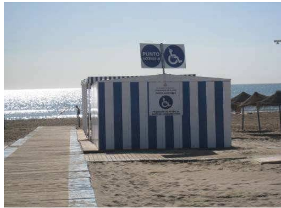
Punto Accesible PINEDO