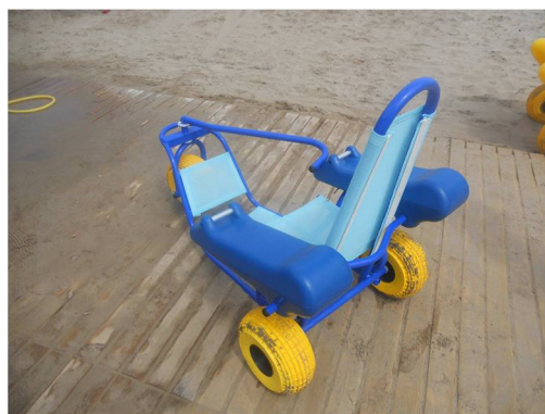
Silla anfibia para niños

Sillas anfibas. Constituyen el elemento clave para el baño ya que mediante ellas son introducidos en el agua, para permanecer bañándose, siendo pioneros en la utilización de las mismas en la playa.