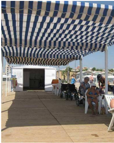
Punto Accesible MALVARROSA