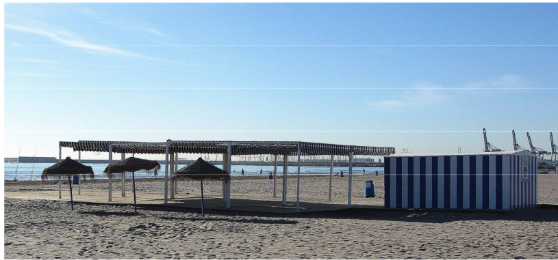
Punto Accesible CABANYAL

Sillas anfibas. Constituyen el elemento clave para el baño ya que mediante ellas son introducidos en el agua, para permanecer bañándose, siendo pioneros en la utilización de las mismas en la playa.