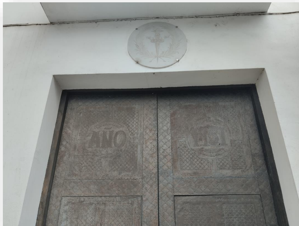
FOTO 2. Detalle de la puerta de la iglesia de San Bernardo