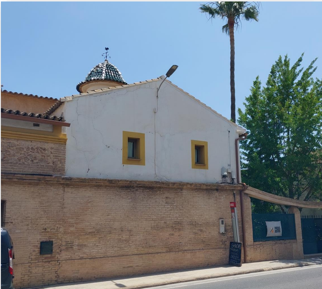
FOTOS 8 Y 9. Casas de estilo tradicional valenciano