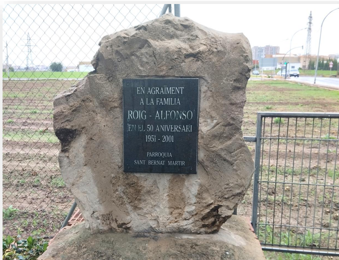
FOTO 5. Monolito dedicado a la familia Roig Alfonso por su colaboración en la construcción de la parroquia.