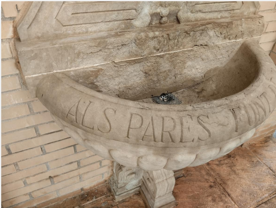
FOTOS 3 Y 4. Fuente junto a la iglesia, dedicada a los padres. ("Als pares, font de tot": a los padres, fuente de todo)