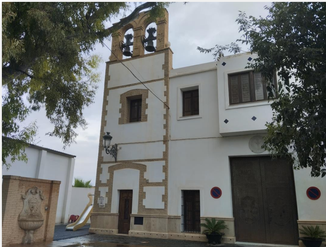
FOTO 1. Iglesia de San Bernardo, al sur de Poble Nou