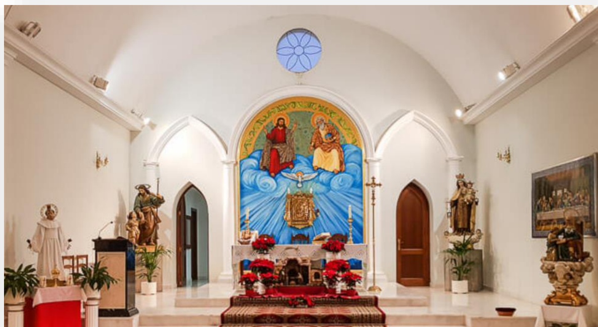
FOTO 6. Interior de la iglesia de San Bernardo