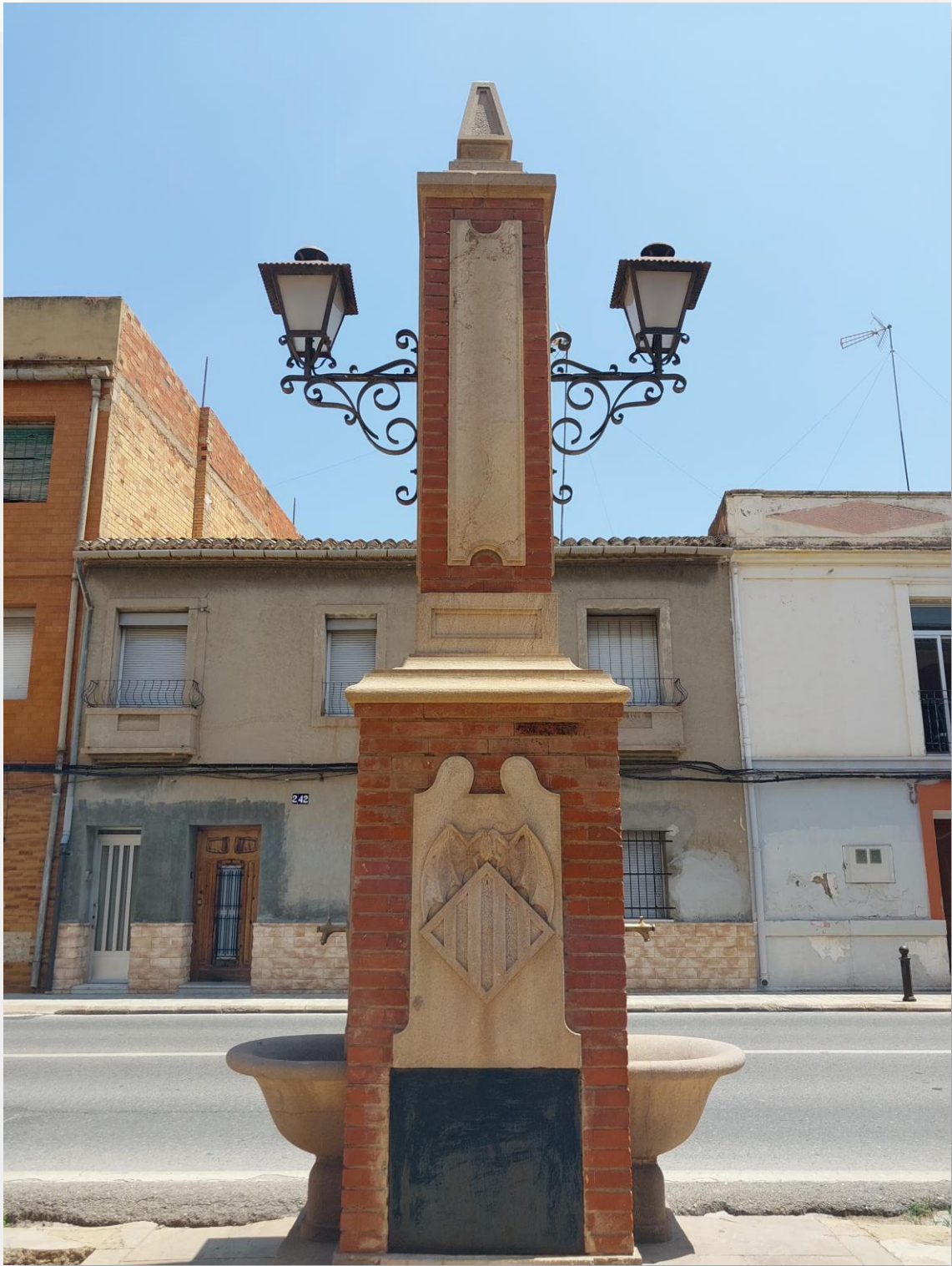
FOTO 7. Fuente junto al camino de Moncada