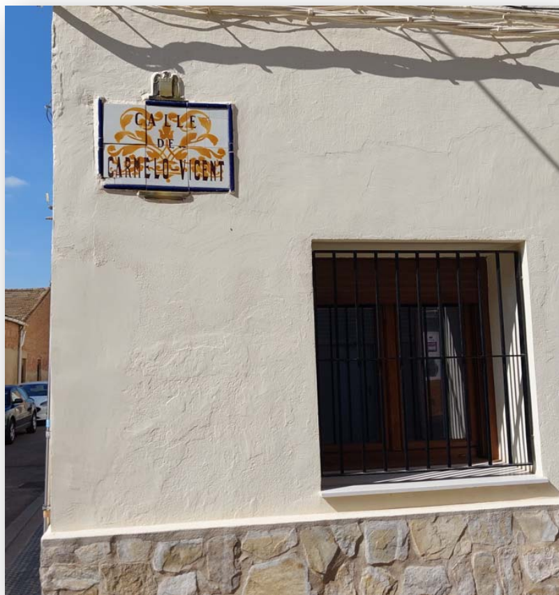
FOTO 5: Calle dedicada al Escultor Carmelo Vicent, originario de Carpesa.