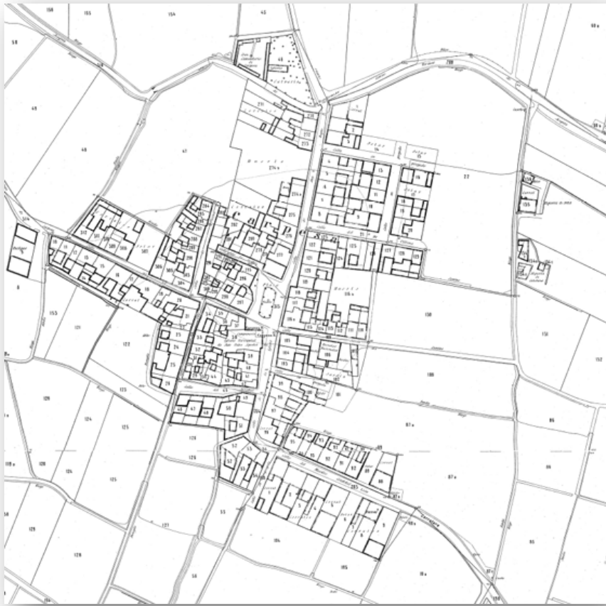
FOTO 3: Plano cartográfico de Carpesa. 1929-1945.