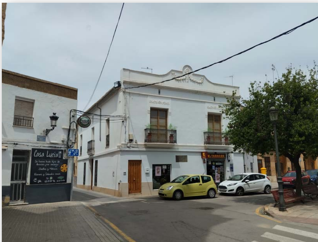
FOTO 8. Casas tradicionales valencianas