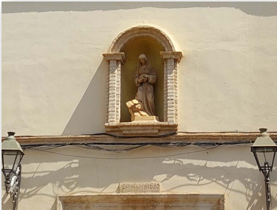
FOTO 2. Detalle de escultura sobre la puerta principal