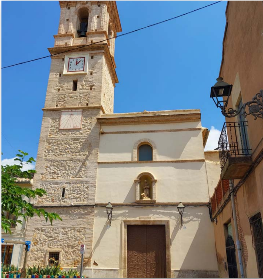
FOTO 1. Iglesia de Santa María Magdalena