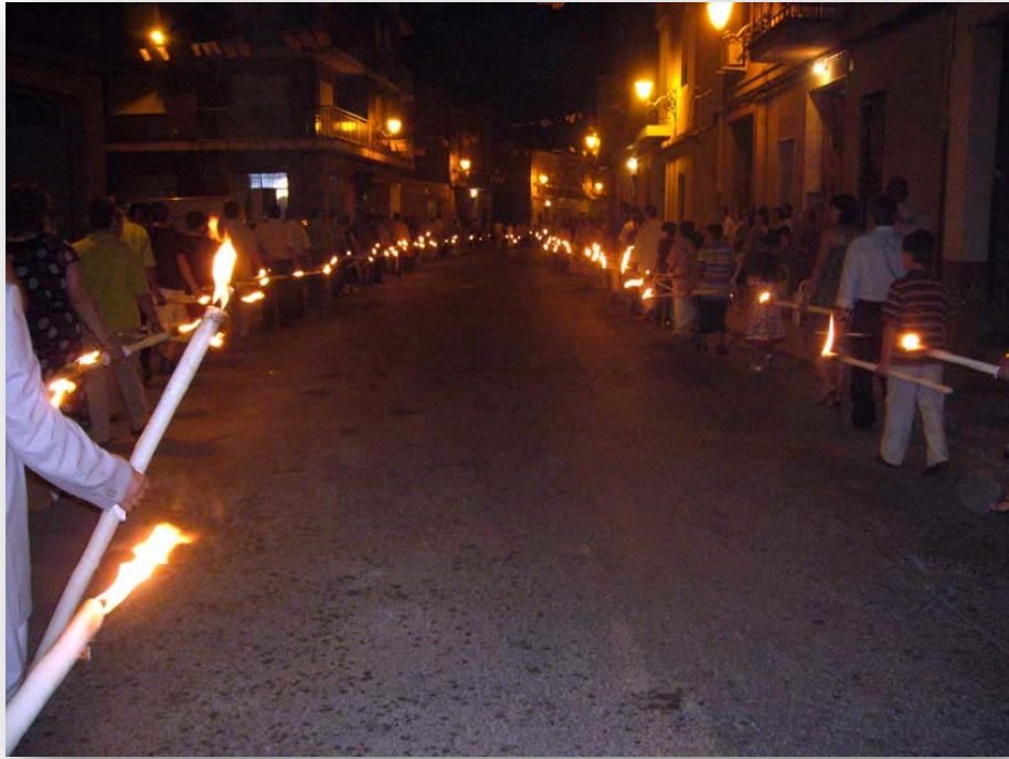
FOTO 5. Procesi3n del Sant3simo Cristo con "les atxes"