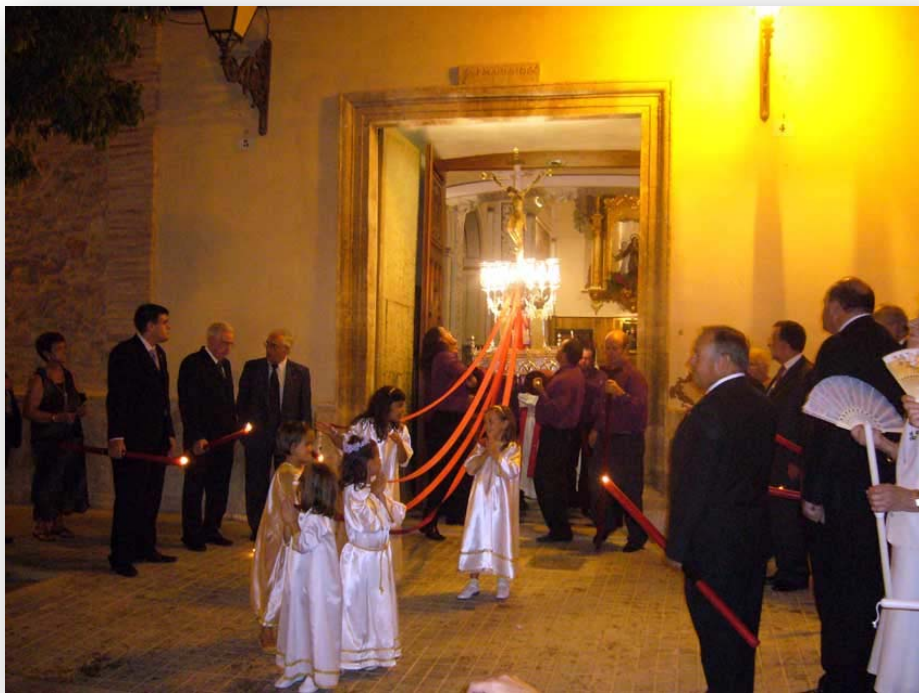
FOTO 4. Procesi3n del Santísimo Cristo con "les atxes"