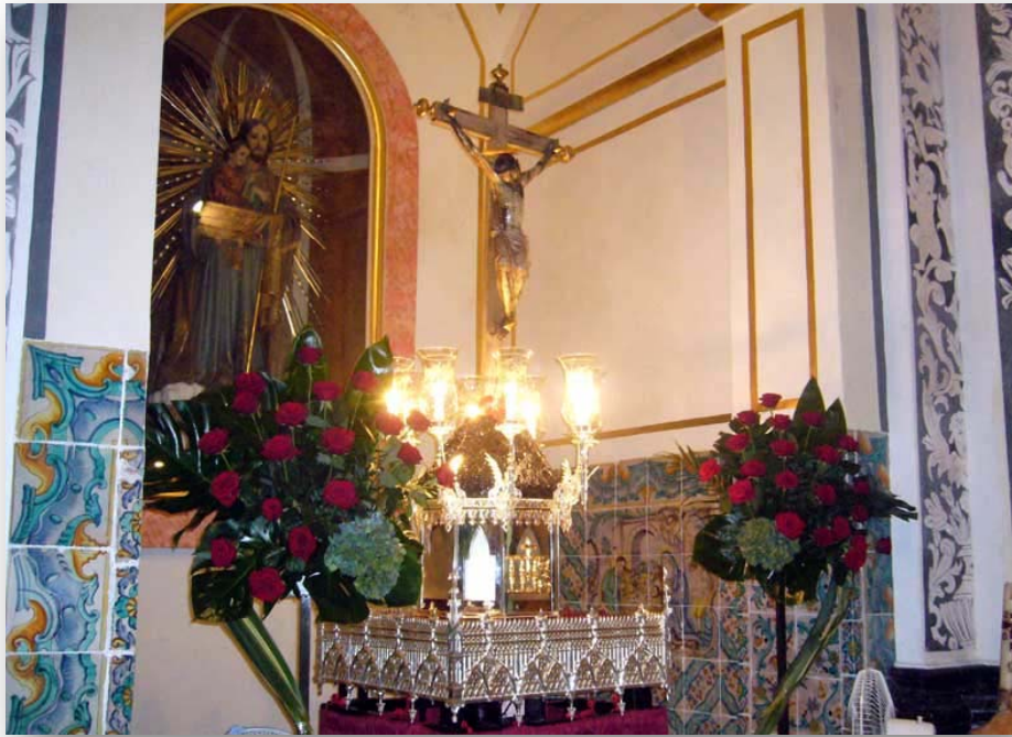
FOTO 3. El Santísimo Cristo Verdadero