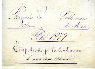
Caràtula de l'expedient

Id. document: VPAX Zgs2 zZzo bTh6 OzVA vGnm +B4= CÒPIA INFORMATIVA (NO VERIFICABLE EN SEU ELECTRÒNICA)