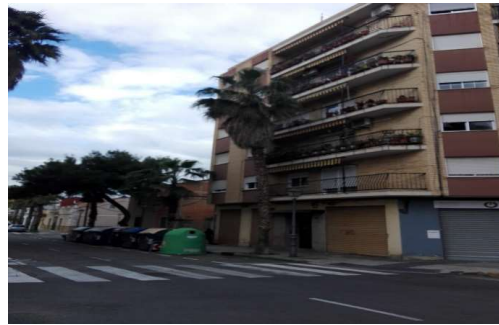
Calle Felipe Valls, nº 86