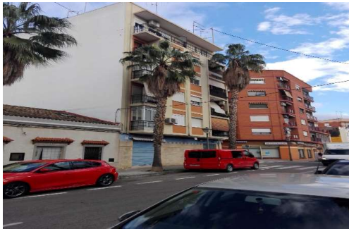
Calle Felipe Valls, nº 76