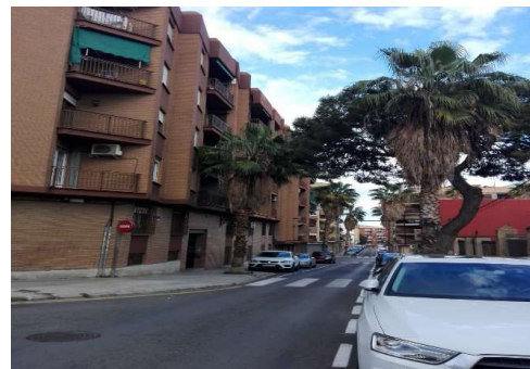
Calle Cullera, nº 26