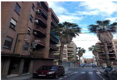
Calle Cullera, nº 22