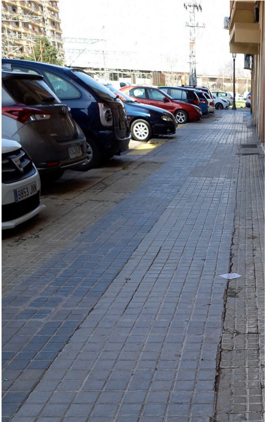
CONSELL DE DISTRICTE DE LA JUNTA MUNICIPAL DE RUSSAFA - ACTA DE LA SESSIÓ ORDINÀRIA DE 28 DE FEBRER DE 2024 / CONSEJO DE DISTRITO DE LA JUNTA MUNICIPAL DE RUSSAFA - ACTA DE LA SESIÓN ORDINARIA 16 DE 28 DE FEBRERO DE 2024