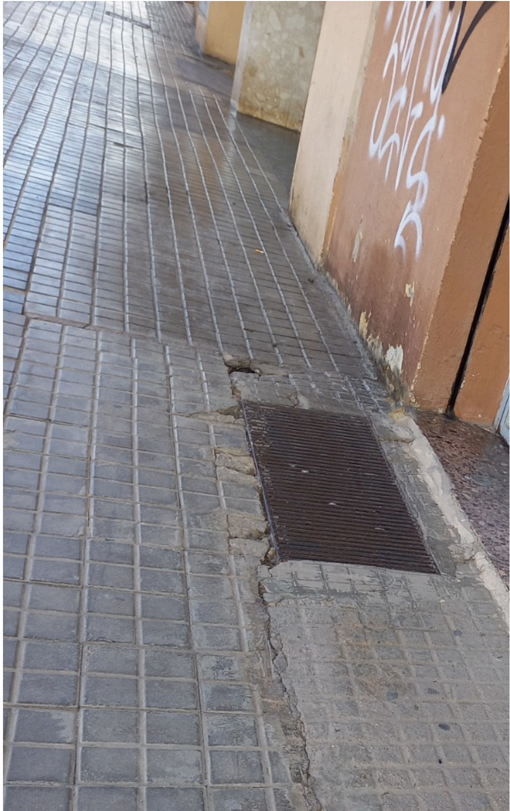
CONSELL DE DISTRICTE DE LA JUNTA MUNICIPAL DE RUSSAFA - ACTA DE LA SESSIÓ ORDINÀRIA DE 28 DE FEBRER DE 2024 / CONSEJO DE DISTRITO DE LA JUNTA MUNICIPAL DE RUSSAFA - ACTA DE LA SESIÓN ORDINARIA 18 DE 28 DE FEBRERO DE 2024

Id. Document: ZF2e k9bc Us+ R 9dB3 IZzZ NK8t Uew= CÒPIA INFORMATIVA (NO VERIFICABLE EN SEU ELECTRÒNICA)