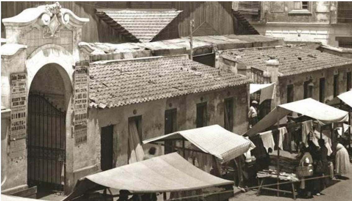
L'antiga plaça del Mercat .

conexedores des de la infantesa de la seua qualitat. Sempre s'ha dit que la gent del barri sap garantir-ne la qualitat i la frescor només mirant els ulls del peix.