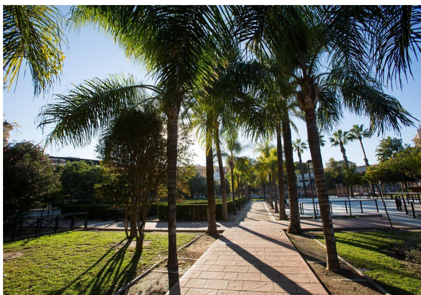
Imagen: Parque del Oeste. Autoría propia

En este sentido, el parque representa un espacio de ocio de Tres Forques y otras zonas de Valencia, ya que cuenta con equipamientos interesantes como piscinas, pistas de patinaje, petanca, cafetería, fuentes y zonas para la diversión infantil en un gran espacio abierto.