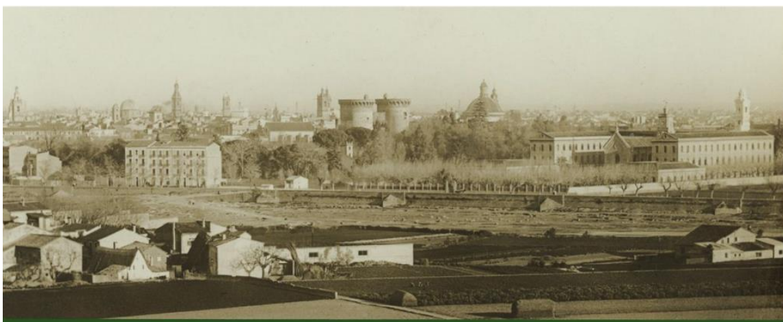
Imatge 1: Orígens del barri El Botànic (a dalt) i en l'actualitat (a baix)

El barri El Botànic pot ser considerat com un dels entorns històrics més significatius de la ciutat de València. Situat extramurs de la ciutat, el seu emplaçament entre la vora del Túria, les muralles i algunes de les principals artèries de la ciutat el van convertir en un entorn significatiu de l'expansió urbana del segle XIX. Una zona marcada per la instal·lació del Jardí Botànic i el col·legi de Jesuïtes que tindria un ràpid creixement en les dècades finals del segle XIX i que acabaria configurant-se al llarg del segle XX.