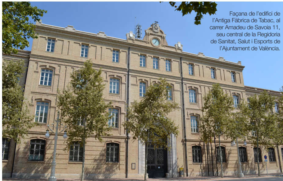
Façana de l'edifici de l'Antiga Fàbrica de Tabac, al carrer Amadeu de Savoia 11, seu central de la Regidoria de Sanitat, Salut i Esports de l'Ajuntament de València.

18 | Nombre de consultes resoltes en termini per correu electrònic